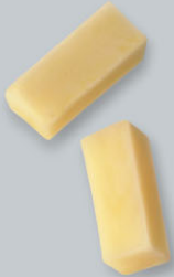
Pommes Pont-Neuf Brückenpfeilerkartoffeln