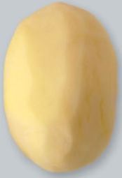
Pommes pelées Geschälte Kartoffeln