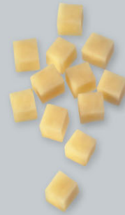
Pommes Parmentier Gebratene Kartoffelwürfel