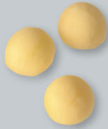
Pommes parisienne Pariser Kartoffeln