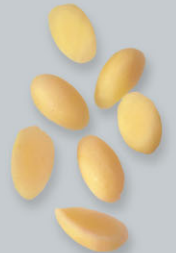
Pommes olivettes Olivenkartoffeln