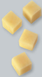
Pommes Maxime Maxime-Kartoffeln