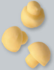
Pommes champignons Champignonkartoffeln