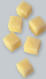
Pommes rissolées Bratkartoffeln