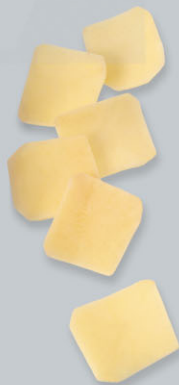
Pommes soufflées Auflaufkartoffeln