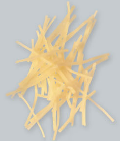
Pommes paille Strohkartoffeln