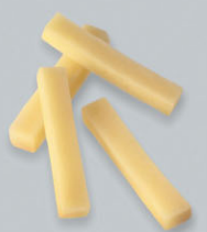
Pommes frites Frittierte Kartoffelstäbe