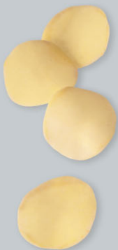
Pommes chips Pommes Chips