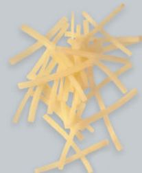
Pommes allumettes Zündholzkartoffeln