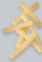
Pommes mignonnettes Frittierte Kartoffelstäbchen